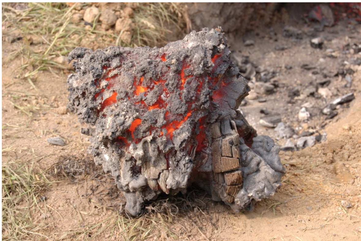
Produkt vcelku po vytažení z pece (J-09-04)

9.5.2009 P.III.ž - Želechovice. Tavba opět využívá praženou hematitovou rudu. V 9:15 zapálení pece a topení dřevem na přirozený vztlak. 10:14 pec zaplněna a zahájeno dmýchání ručním měchem. 10:46 uzavřen vodorovný kanál pece. Předehřev byl dokončen v 11:09 poslední samostatnou vsázkou CHC. Předehřev celkem 3,5 kg CHC za 33 min. 11:13 až 15: 41 rovnoměrné přísazování, celkem přísazeno 17,5 kg rudy. Dále pec dohořívala zaplněná pod větrem do 16:28, kdy byla otevřena. Při pokusu o zhutnění se houba rozpadala a nakonec z ní zůstalo cca 20 větších kousků. Vzhledem k tomu považujeme tuto tavbu za „neúspěšnou“. Výtěžek po nadrcení a přebrání znovu použijeme jako vsázkou.