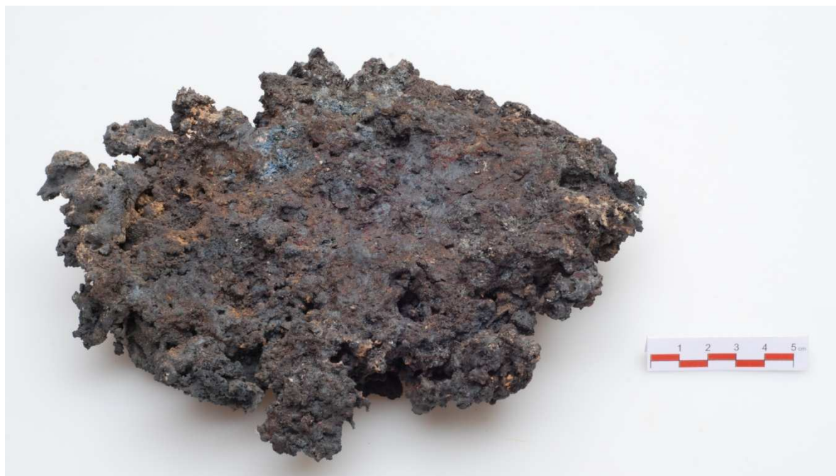
Železná houba 2,68 kg (J-09-06)

20.9.2009 pec s označením P.II. Pec zaplněna v 9:45 a předehřívána od 10:01 do 10:42. Celkem 5,5 kg CHC za 41 min. Rovnoměrné přísazování 10:50 až 12:39. Vsazeno 7,5 kg rudy a 5 kg okují. Pec dohořívala plná pod větrem do 13:00. Následně byla vylomena a houba byla stejně jako v předchozí tavbě nahrubo zpracována dřevěnou palicí s využitím teploty čerstvě vylomené houby.