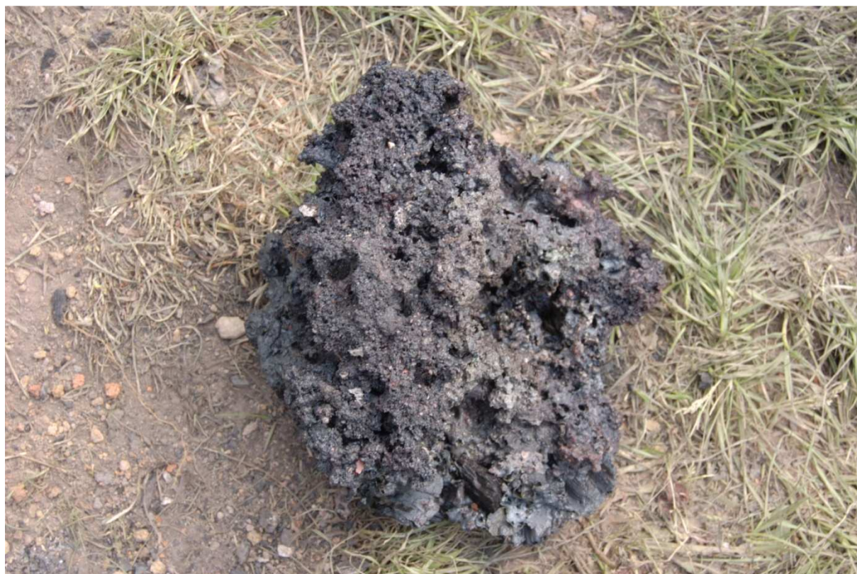
Železná houba 5 kg (J-09-03)