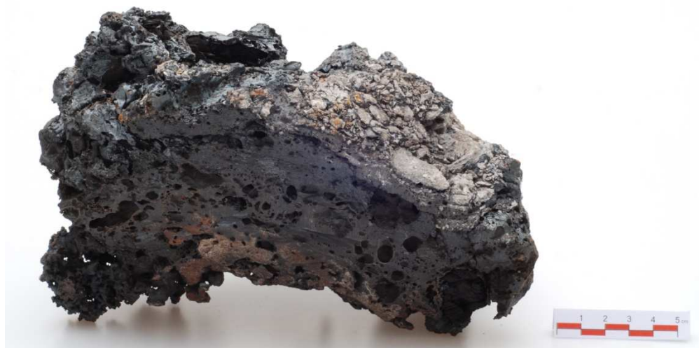
1. Polovina rozříznutého kusu 3,287 kg vč. strusky (J-09-01)

5.5.2001 pec P.I. Tavba byla zahájena v odpoledních hodinách intenzivním vypalováním dřevem. Po prvním zasdění si pec vyžádala opravu, takže byla konečně zaplněna až po 1 a \frac{3}{4} hodiny a připojena na plný výkon ventilátoru. Kompletní náplň pece činila 8 kg uhlí. Poté byl i z přední strany k peci přihrnut písek jako tepelná izolace. 17:15–18:30 probíhal předeheřev, při kterém bylo spáleno celkem 5 kg dřevěného uhlí (dále jen CHC) - tedy za 75 min. V 18:44 byla přisazena první dávka rudy (pražený hematit) a pokračovalo pravidelné přisazování rudy a CHC v hmotnostním poměru 1:1. Dávky byly navažovány po 0,5 kg. Celkem bylo do 22:12 přisazeno 10 kg rudy a 10,5 kg CHC. Následovalo vyhořívání při stále zaplněné peci a ventilátoru do 23:58, kdy byl ventilátor odstaven. Pec byla ponechána pozvolnému dohořívání do dalšího dne a byla vylomena 6.5. v 10:00 - tedy celkem 10 hodin. Vytěžená houba nebyla dokonale separovaná od strusky a vytvořila spolu se struskou bochník. Ten byl v dílnách TMB rozřezán úhlovou bruskou na poloviny. I. polovina váží 3,287 Kg II. polovina 2,837 Kg, celkem tedy 6,124 Kg. Pokud by hmotnost železa činila 50%, potom by se jednalo o výtěžek cca 3 kg. S touto hmotností budeme dále počítat.