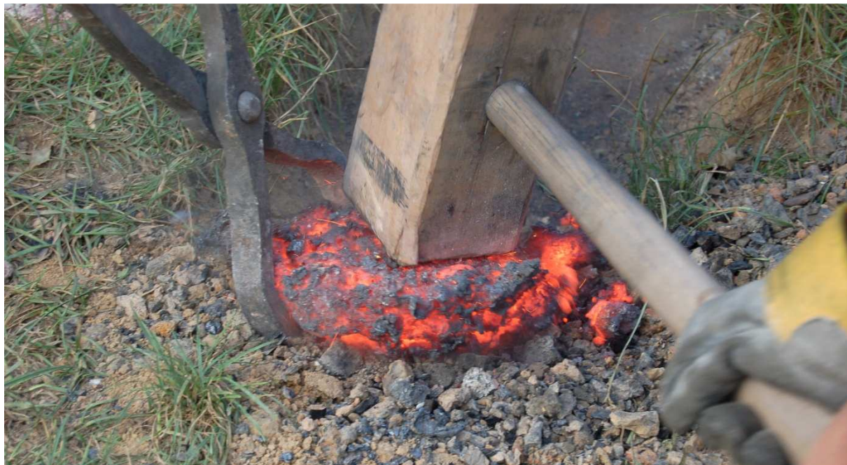
Základní zpracování s využitím teploty houby vytažené z pece

19.9.2009 Pec s označením P.I. po malé opravě pracuje bez potíží. V 13:12 je pec za dmýchání zaplněna. Předehřev probíhá od 13:21 do 14:07, spáleno 7 kg CHC za 48 minut. Měkčí uhlí z milíře subjektivně velmi rychle hoří. V časovém úseku 14:12 až 16:21 rovnoměrné přísazování rudy (celkem 8 kg) a okují (6 kg), tedy celkem kovonosná vsázka 14 kg. Do 16:57 dohořívání pod větrem. Pec byla ihned vylomena. Struska byla nápadně tekutá a byla zateklá i kolem štítku z vnější strany. V důsledku toho byla také velmi dobře vyseparovaná železná houba o hmotnosti 3.5 kg.