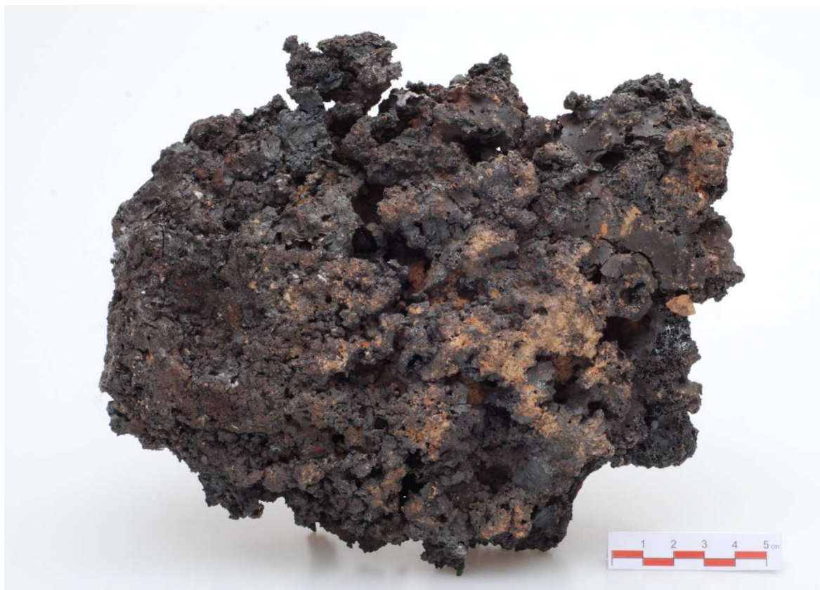
Železná houba před rozříznutím 3,5 kg (J-09-05)