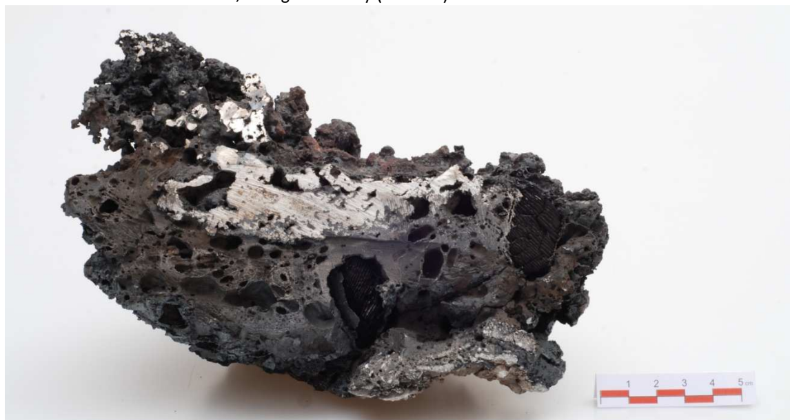
2. Polovina rozříznutého kusu 2,837 kg vč. strusky (J-09-01)