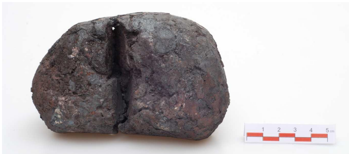
Naseknutá houska 1,9 kg (J-09-03)

8.5.2009 pec P.II. Tato tavba byla vedena výhradně s rudou z nálezů u lomu Mokrá-Horákov (Fojt 2007) bez míchání s OLD. Pec byla zaplněna a pod plným ventilátorem v 11:35 a poslední vsázka předeřevu CHC byla zapsána v 12:18. Celkem bylo spáleno 4 kg CHC za 43min. Ve 12:14 se samovolně nad pecí vzňaly kychtové plyny se slyšitelným pufnutím. V časovém úseku 12:22-15:59 jsou rovnoměrně přísazovány ruda a CHC. Celkem bylo zpracováno 21 kg rudy. Odpichy byly provedeny v časech 14:05, 15:20 a 16:03. Zaplněná pec byla udržována pod větrem ještě do 16:30, kdy byla naposledy odpuštěna struska. Pec byla ponechána postupnému chladnutí a byla vylomena následující den v 10:30 – tedy 18 hodin. Výsledkem byla velmi dobře separovaná železná houba o hmotnosti cca 5 kg. Houba byla ihned postoupena týmu kovářů k dalšímu zpracování (JK-09-02). Získána byla nakonec houska o celkové hmotnosti 1,9 kg.