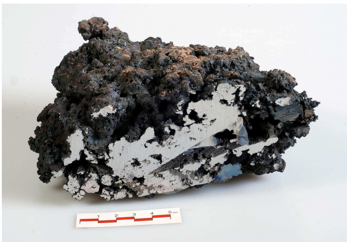
2. polovina rozříznuté houby (J-09-05)