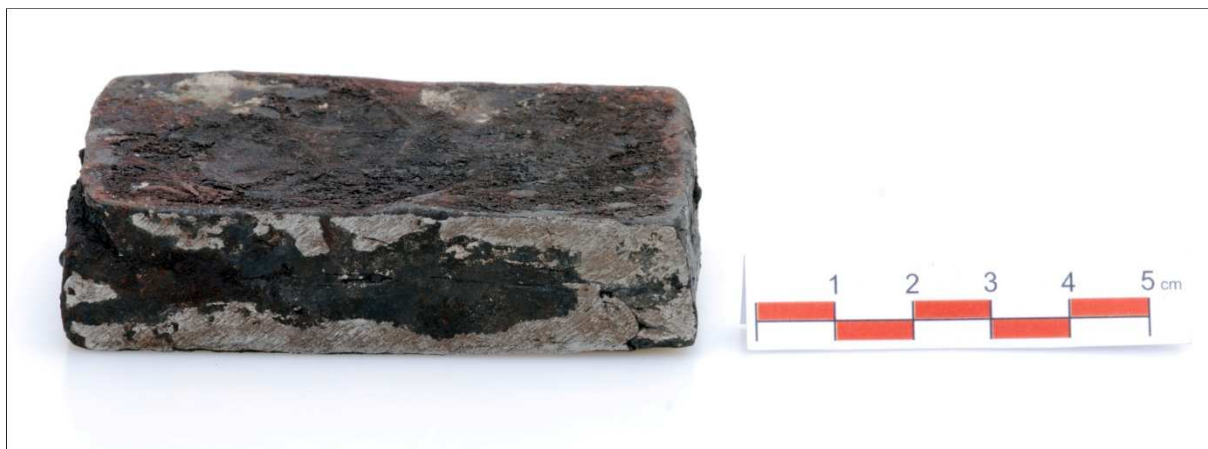
Přeložený paket 0,45 kg (J-09-02)

7.5.2009 pec P.I. Pec zazděna a zapálena s připojeným ventilátorem v 10:54. 11:15 je pec zcela zaplněna CHC a začíná přehřev. V 12:19 byly pro kontrolu zapáleny kychtové plyny jako indikace teploty hoření. Přehřev trvá do 12:24, celkem spáleno 6 kg CHC za 69 minut. Ve 12:28 první vsázka vlastního separovaného strusko železného odpadu (dále jen OLD). Následují střídavě vsázky pražené rudy a OLD, v celkovém hmotnostním poměru kovonosné vsázky a CHC 1:1. Poslední vsázka rudy byla provedena v 18:32. OLD bylo vsazeno celkem 7,5 kg a rudy 8,5 kg, dohromady tedy kovonosná vsázka činila 16 kg. Ve 14:05 byla provedena inspekce, struska se sice lepila na tyč, ale odpich se nezdařil. Úspěšně proběhl odpich strusky v 16:19, kdy bylo získáno celkem 1,25 kg strusky. Další menší odpich následoval v 17:44. Pec byla po hodinovém dohořívání (pec pod ventilátorem a udržována plná) vylomena ve 20:27. Ihned byla provedena základní separace železného kusu od tekuté strusky a první kování dřevěnou palicí. Získaný železný kus měl hmotnost 2,2 kg a po dalším kovářském zpracování (JK-09-01) byl získán polotovar o hmotnosti 450 g.