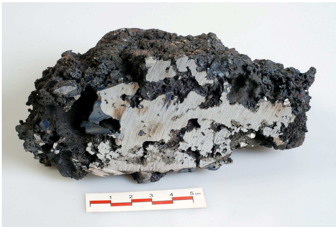
1. Polovina rozříznuté houby (J-09-05)